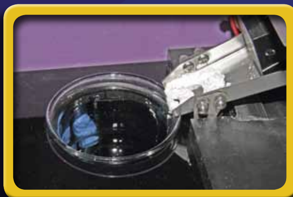
Vista del particolare del sistema di dosaggio automatico

Due to numerous requests from many of our customers, CheckStab Instruments® , leader in the development of instruments for the analysis of tartaric stability in wines, has developed a new generation instrument. The latest unit is the Check Stab \alpha 2012 Life , a completely automatic analyzer capable of satisfying all types of wineries, small or large. The laboratory can connect from 1 to 16 instruments together, all controlled by one software CheckStab Net®, with the data stored on one single Data Base. The instrument has an automatic KHT dispensing system. The connection of the analyzer to the computer is done by means of LAN which makes data management much more simplified thanks to the standardization of the communication protocol.