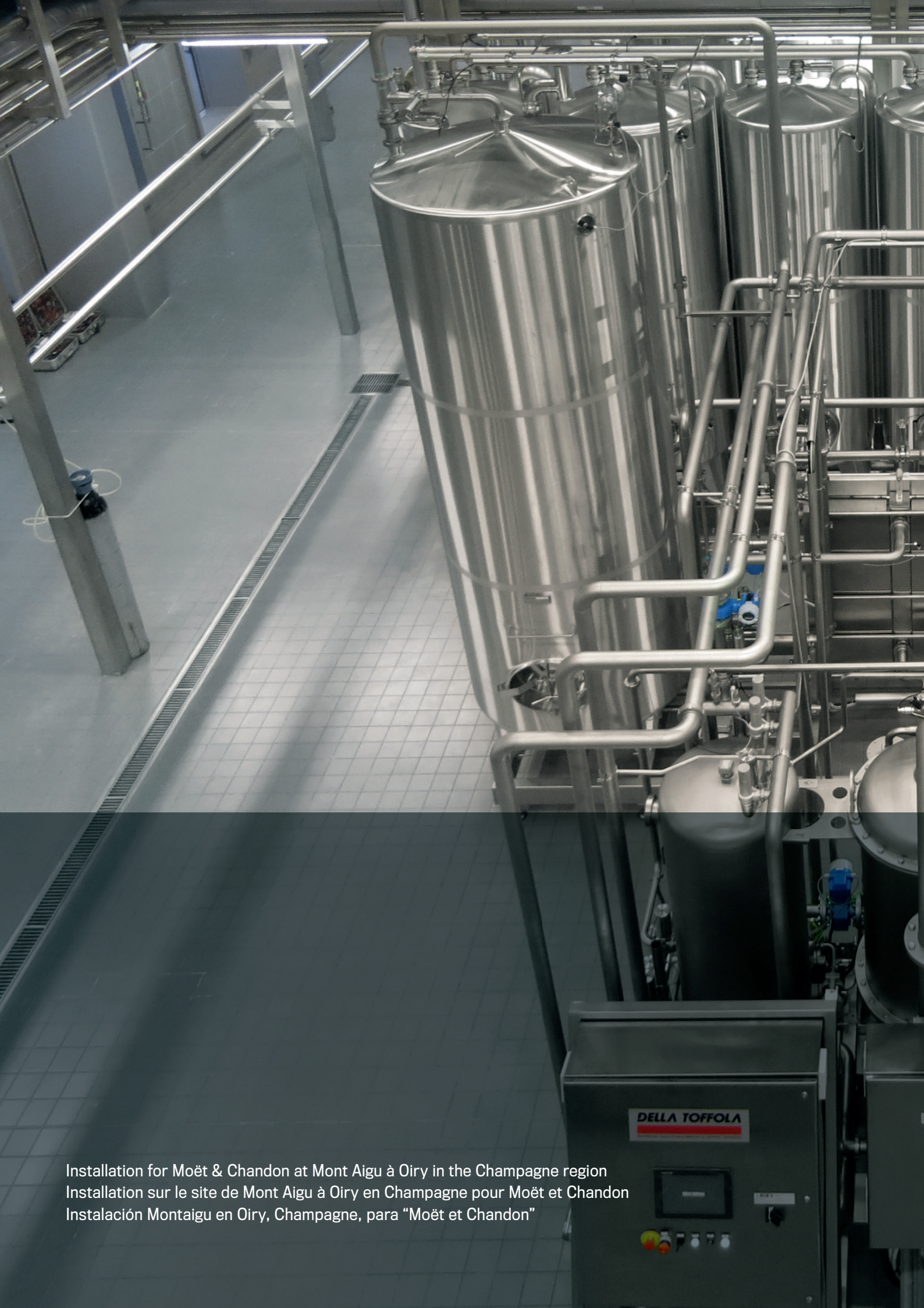
Installation for Moët & Chandon at Mont Aigu à Oiry in the Champagne region Installation sur le site de Mont Aigu à Oiry en Champagne pour Moët et Chandon Instalación Montaignu en Oiry, Champagne, para "Moët et Chandon"